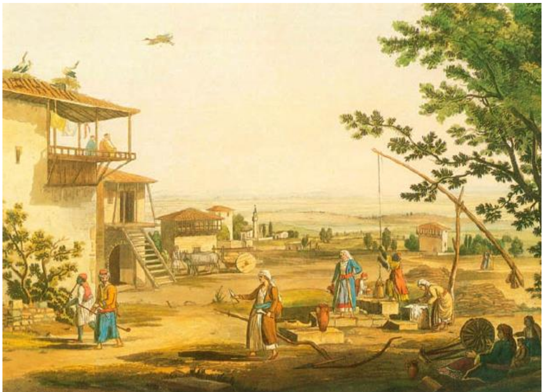
Σκηνή από αγροτικές εργασίες στην αυλή ενός σπιτιού Έγχρωμη χαλκογραφία, Edward Dodwell, Μουτσόπουλος, 1993, σελ.375