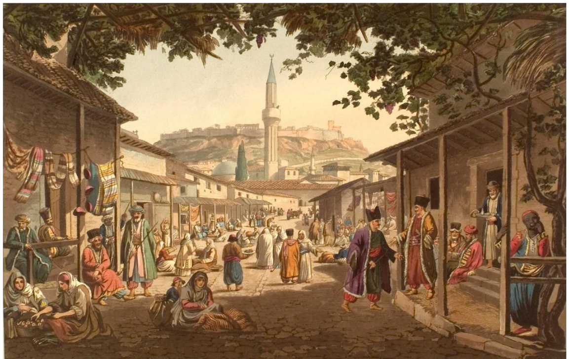
Η αγορά της Αθήνας (1805) Edward Dodwell