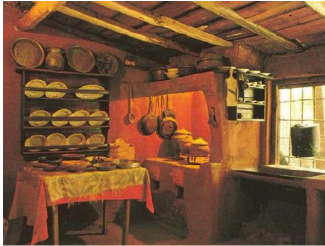
Κουζίνα σε καστοριανό αρχοντόσπιτο, Μητσόπουλος, 1989, σελ. 46