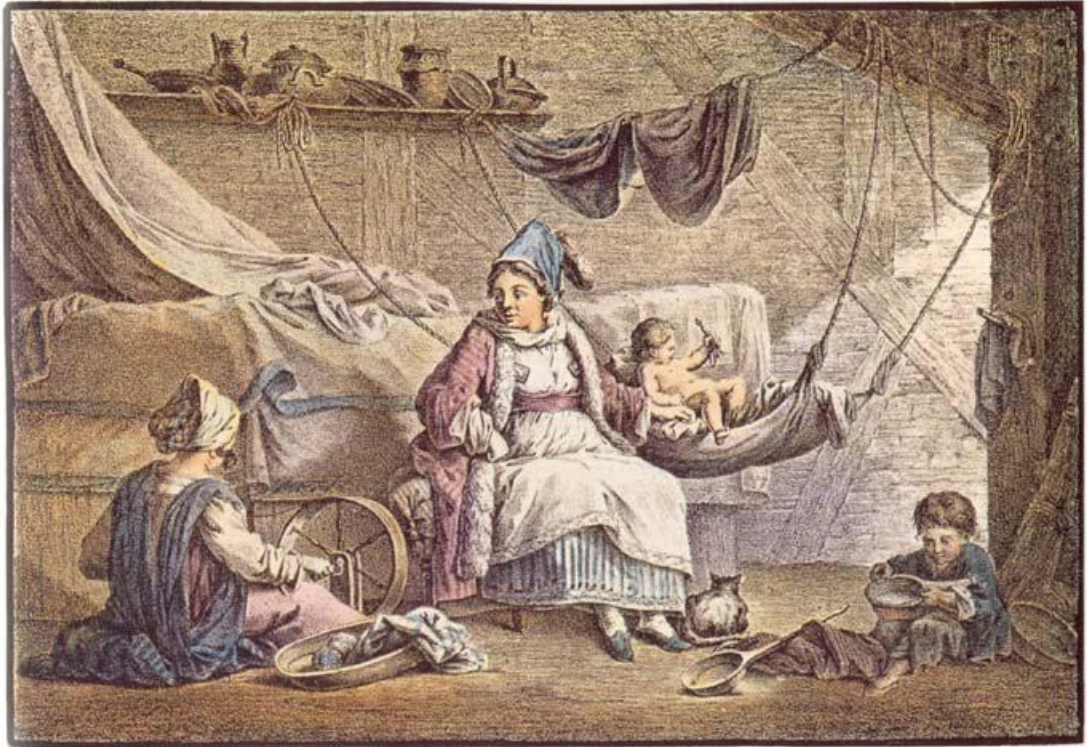
Εσωτερικό σπιτιού (18ος αι.) Έγχρωμη λιθογραφία σε σχέδιο του Υλαίρ, Μουσείο Μπενάκη