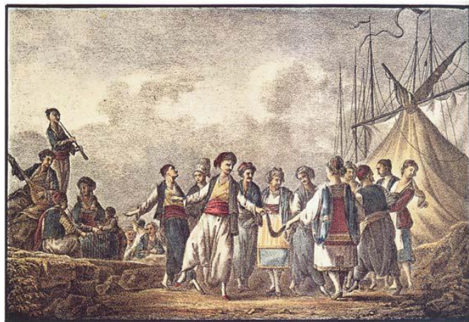
Ελληνικός χορός στην Πάρο (18ος αι.)