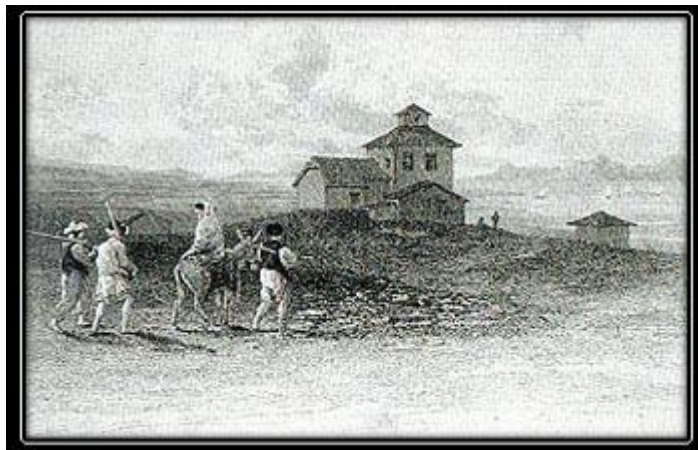
Αγρότες στο δρόμο προς το χωράφι, 1824, Χαλκογραφία, Σχέδιο P. Dewint, χάραξη G. Cook, Εθνική Βιβλιοθήκη